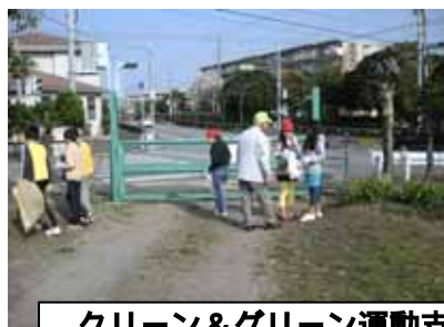
クリーン&グリーン運動支援