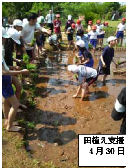
田植え支援・5年生 4月30日(火)