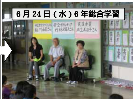
6月24日(水) 6年総合学習

地域で、ボランティアをしている方を招いて、自分たちがやるためのヒントをいただきました。