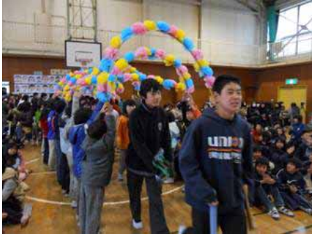
・花輪のトンネルに迎えられ！

秋津小学校の平成 21 年度は、大きな事故も無く、間もなく三学期を終了します。これも地域の皆様の見守りがあったお陰と、心より感謝申し上げます。そして、秋津小学校を卒業する 6 年生の皆様、『ご卒業おめでとうございます！』。卒業しても、秋津小学校で学んだ、たくさんのやさしさや思いやりを忘れずに、大きく成長してください。中学生になっても、後輩の手本として、大きな声であいさつを交わしてくれることを期待しております。（下の写真は、“6 年生を送る会”より）