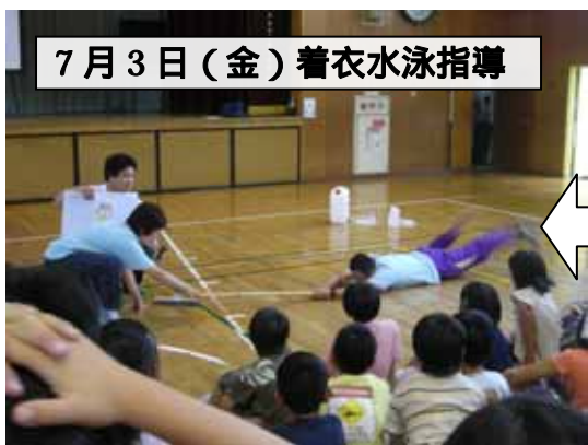
7月3日(金) 着衣水泳指導

中国・フィリピン・ロシア・ペルーのデザートを紹介してもらい、文化や国の特徴を教えてもらいました。味見もしたよ！