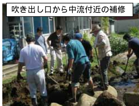
吹き出し口から中流付近の補修