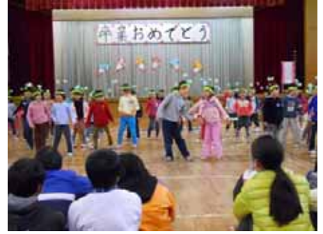
・可愛いおどりを披露！