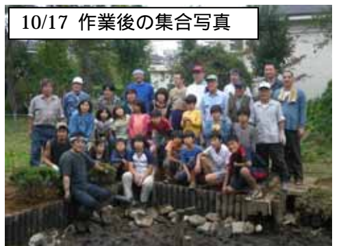
10/17 作業後の集合写真