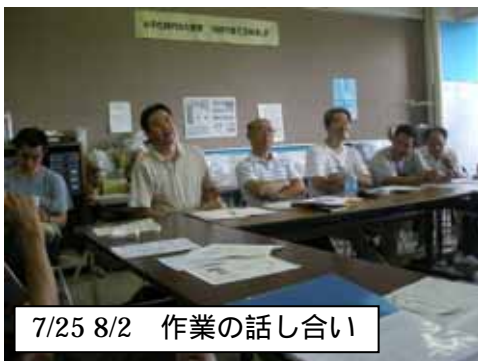
7/25 8/2 作業の話し合い

6 月 18 日にパートナー会議メンバー・地域住民有志・児童会・教職員で、『秋津小ピオトープ整備実行委員会』を立ち上げ、ピオトープ整備・改修事業を進めております。児童が自然に親しみ、また自然を学習することを目的に、ピオトープの整備とその活用を図るために“平成 21 年度 生物多様性体験学習推進事業補助金”の申請を行い、補助金(40 万円)交付を受けることが出来ました。他、財源は地域(秋津誕生 30 周年記念事業より 10 万円・教職員と PTA バザー & 皆様の募金合計 65,277 円・有志寄附 36,009 円)で、総額 60,1286 円(現在)となっております。秋津まつりでは、たくさんの募金をいただきましたこと、紙面を借りて厚くお礼申し上げます。では、記録写真で作業の様子を紹介します。