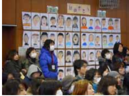
・1 年生が 6 年生の似顔絵を！