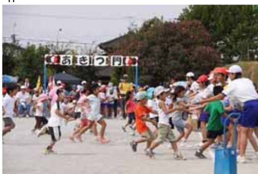
就学時前の子どもたちも張り切って参加してくれました。