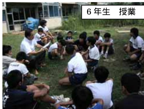
6 年生 授業