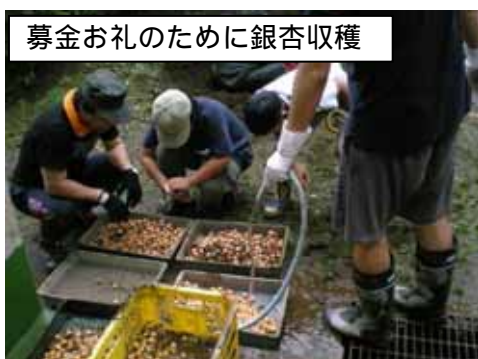
募金お礼のために銀杏収穫