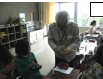
クラブ活動支援 4月21日(火)

今年もたくさんのボランティアの方々が、子どもたちを支援する活動を始めてくださっております。