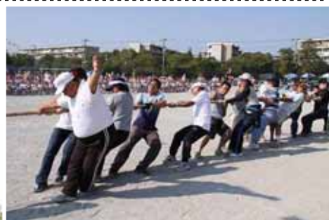
地域の大人も子どもたちに負けない底力を出し切っていました。(筋肉痛は無かったかな) 秋津名物“秋津ソーラン”は生演奏・生歌で、パッパポーズ!