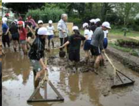
しろかき支援・5年生 4月21日(火)