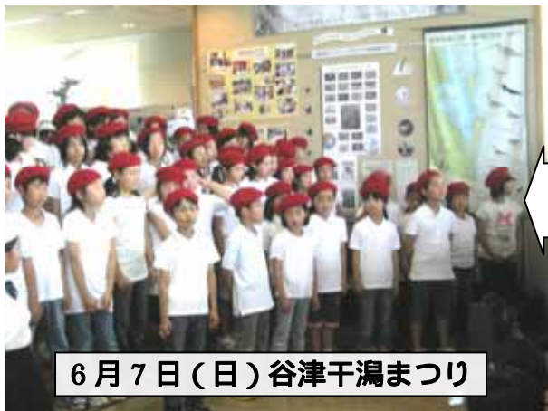
6月7日(日) 谷津干潟まつり

谷津干潟観察センター内でのコンサートに、金管バンドのみなさんが、参加しました。たくさんのお客の前での披露でしたが、伸び伸びとした歌声に大きな拍手をいただきました。