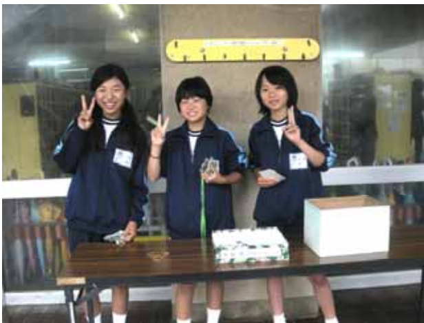
日曜参観の受付をお手伝い！

6 月 21 日（日）は、日曜参観日でした。卒業生の 3 人が、『雨で部活がなくなったから、手伝いに来ました！』と七中ジャージで来校。元気な笑顔で、日曜参観の受付を手伝い始めました。（うれしいですね。）在校中に身についたボランティア精神が、こうした行動に表れたのでしょうか？それとも、日頃から地域の皆様に支えられて育ててきたからなのでしょう？