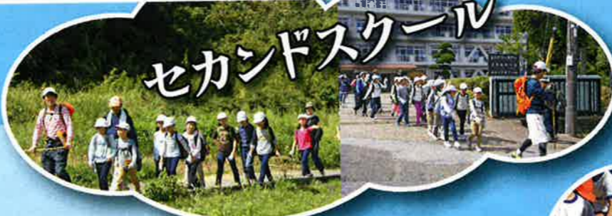
セカンドスクール