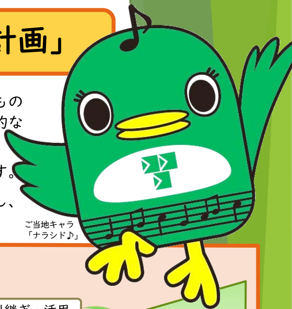
ご当地キャラ 「ナランド♪」

各関係機関が連携し、保護者の同意のもとに引継ぎし、よりよい支援のために活用していきます。