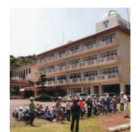
（平成21年 鹿野山セカンドスクール）