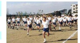
（平成5年 マラソン大会）