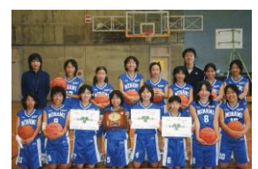
（平成18年 ミニバス大会）